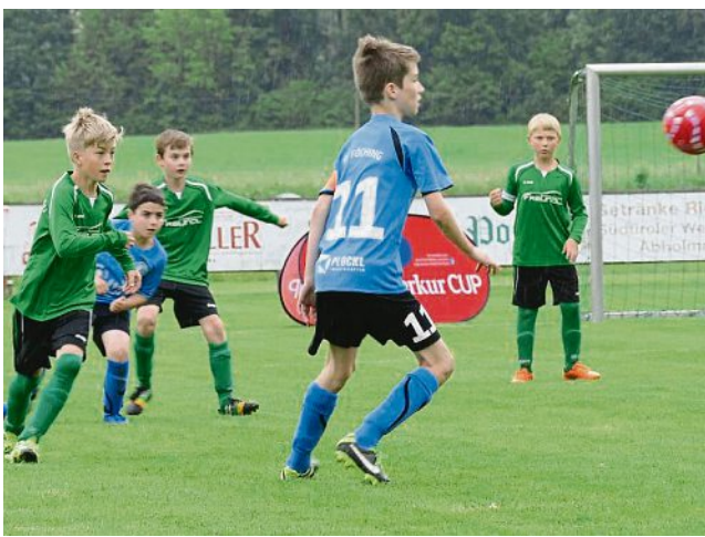
Schwerer Gegner 1: Die SF Föching (in Blau) hatten es mit dem späteren Finalisten SV Wargau zu tun.