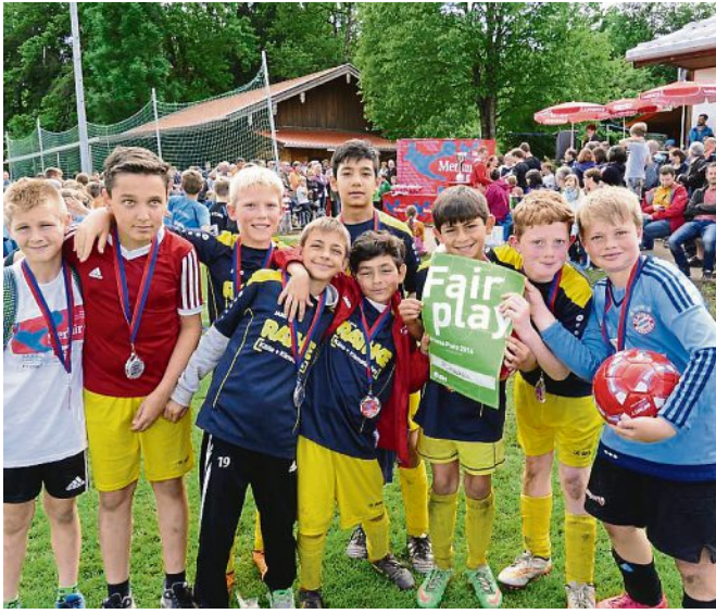
Die Fairsten: Die E-Junioren des FC Hausham 07 freuen sich über den E.ON-Fairness-Preis.

Ein Fußballfest haben die acht Mannschaften beim Merkur CUP Kreisfinale am Samstag gefeiert. Der SV Wargau hat durch die perfekte Organisation den idealen Rahmen geschaffen. Die zahlreichen Zuschauer sahen tolle und faire Spiele. Über den Einzug ins Bezirksfinale freuen sich Gastgeber Wargau und der TuS Holzkirchen.