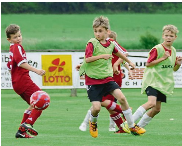
Das kleine Finale um Platz drei entschied die DJK Darching (in Gelb) gegen den TSV Otterfing für sich.