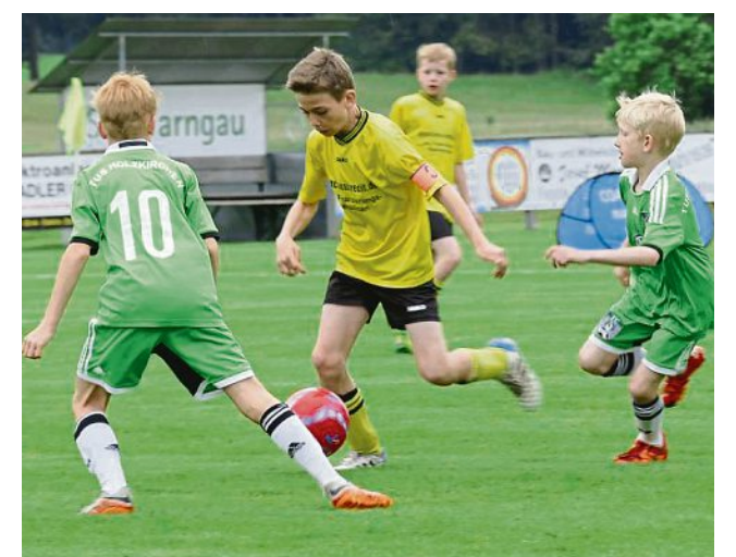
Schwerer Gegner 2: Der TSV Hartpenning (in Gelb) musste gegen den späteren Turniersieger TuS Holzkirchen ran.