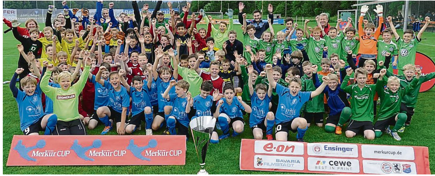
Hatten einen tollen Fußball-Tag: Beim Kreisfinale in Wargau waren folgende Teams dabei: SV Wargau, TSV Otterfing, TSV Hartpenning, SF Föching, TuS Holzkirchen, DJK Darching, TSV Schliersee und FC Hausham 07.