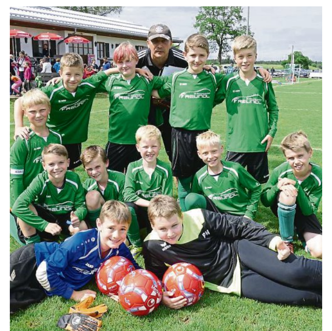
Zweiter Sieger: Die E-Junioren des SV Wargau haben sich ebenfalls für das Bezirksfinale qualifiziert.