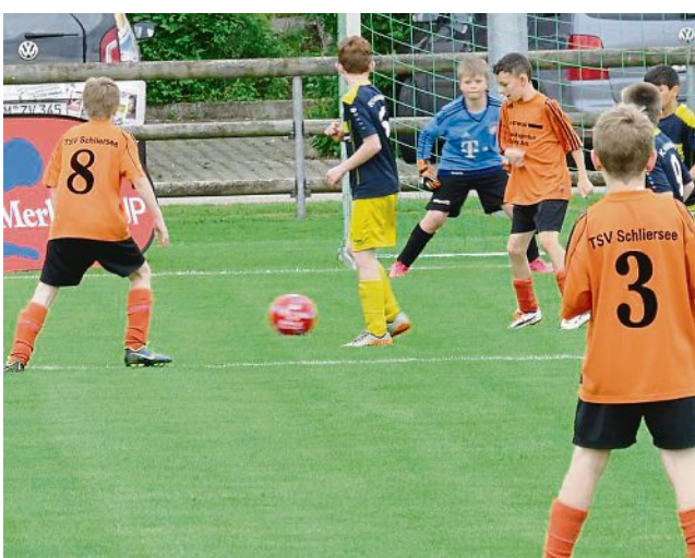
Die Kleinsten: Die Schlierseer (in Orange) konnten körperlich dem FC Hausham 07 nicht viel entgegensetzen.